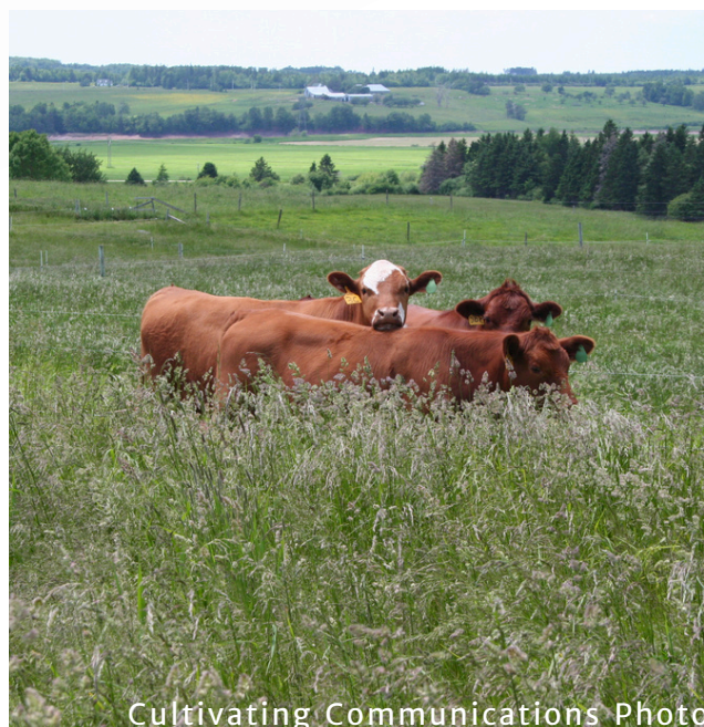
Cultivating Communications Photo

Créé en 2012, le prix du leadership de l'ACPF rend hommage aux personnes et aux organisations dont le travail a eu un impact significatif, à l'échelle nationale ou internationale, sur le secteur du fourrage et des prairies. La Station de recherche de Nappan incarne ce leadership par ses contributions soutenues à l'excellence en recherche, au transfert des connaissances et à l'innovation dans le secteur. Son travail continue de renforcer les fondements sur lesquels reposent les communautés canadiennes du fourrage et des prairies.