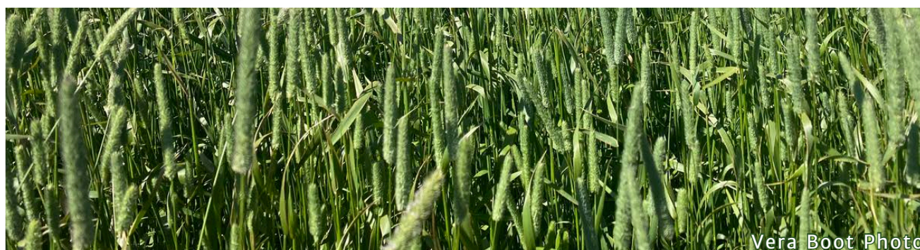
Vera Boot Photo

Merci de votre soutien continu. Nous sommes impatients de façonner ensemble la prochaine décennie.