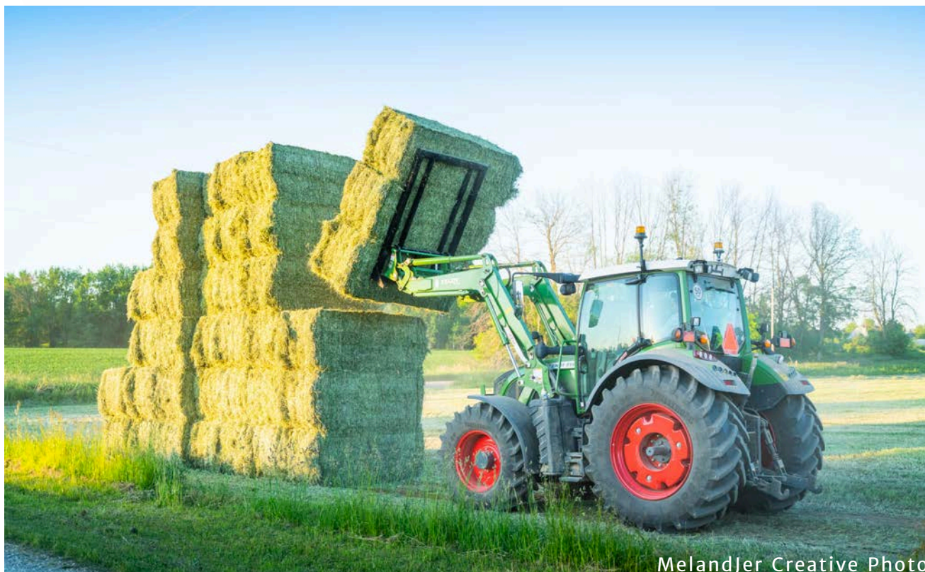
MelandJer Creative Photo