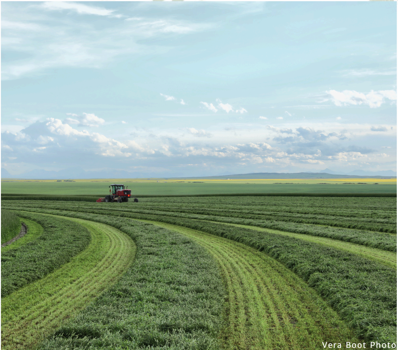
Vera Boot Photo