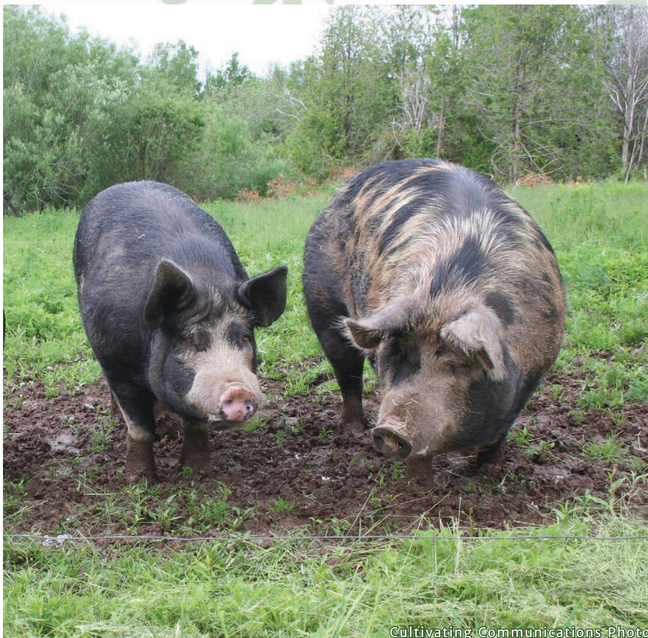
Cultivating Communications Photo

L'ACPF a continué de renforcer son rôle de pôle national de connaissances tout au long de l'exercice 2025-2026. Elle utilise toute une gamme de plateformes numériques et d'outils de communication pour partager des ressources, promouvoir des événements et interagir avec les producteurs, ses partenaires et l'ensemble de la communauté agricole.