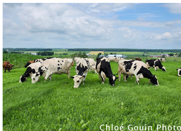
Chloé Gouin Photo