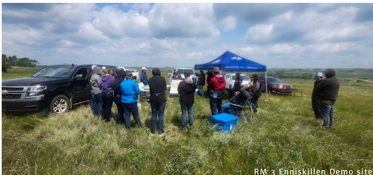
RM 3 Enniskillen Demo site

Faire connaître les avantages du secteur des fourrages et des prairies au Canada en tant que composante essentielle de l'industrie agricole canadienne